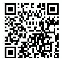
架空請求専用QRコード

※ここに寄せられた情報については、受信専用ですので回答いたしません。犯罪の捜査及び予防のための資料とします。